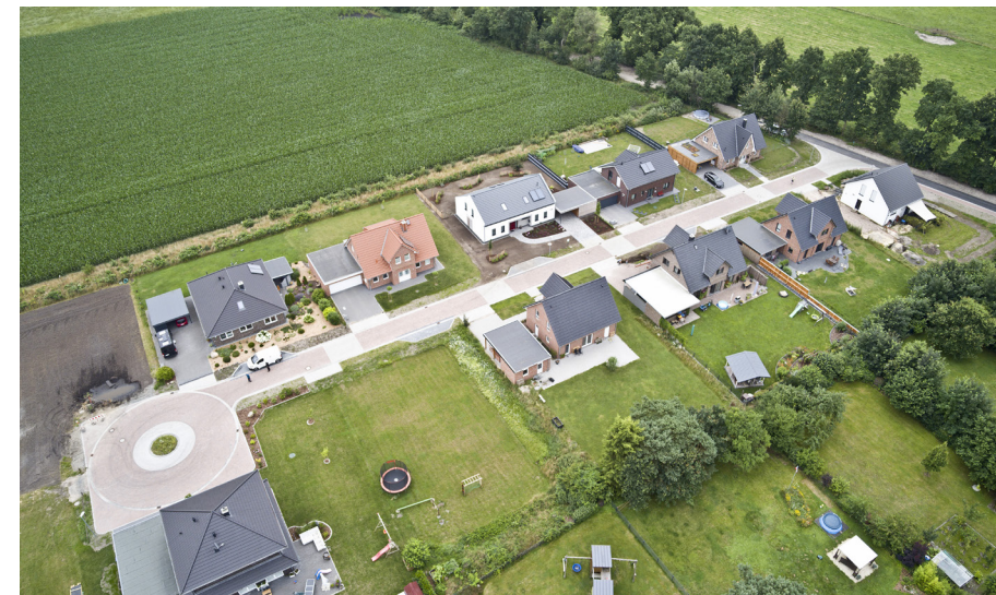
Gelungenes Neubaugebiet „Am Weden“